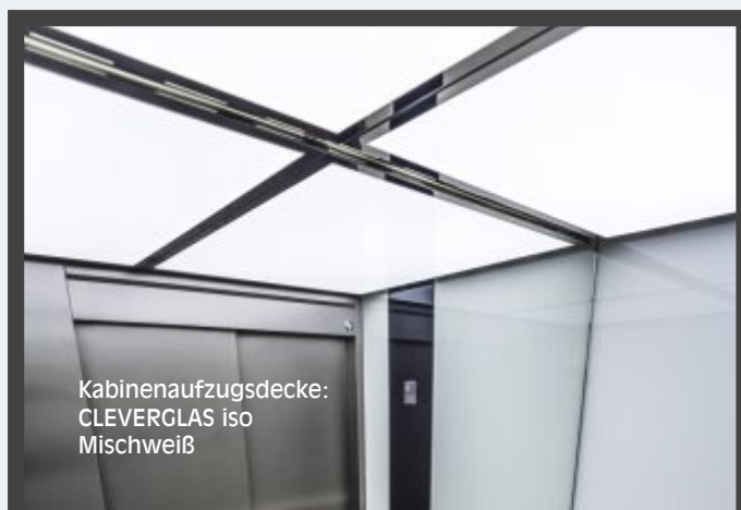
Kabinenaufzugsdecke: CLEVERGLAS iso Mischweiß